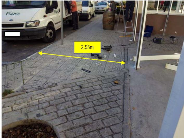
Acera desde la que se accede al espacio público

Excmo. Ayuntamiento de Alhama de Granada.