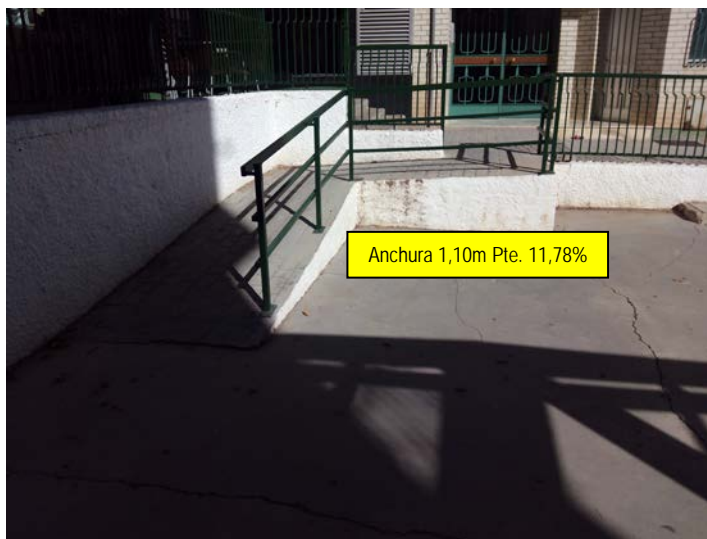
Rampa para salvar el desnivel existente de 65cm